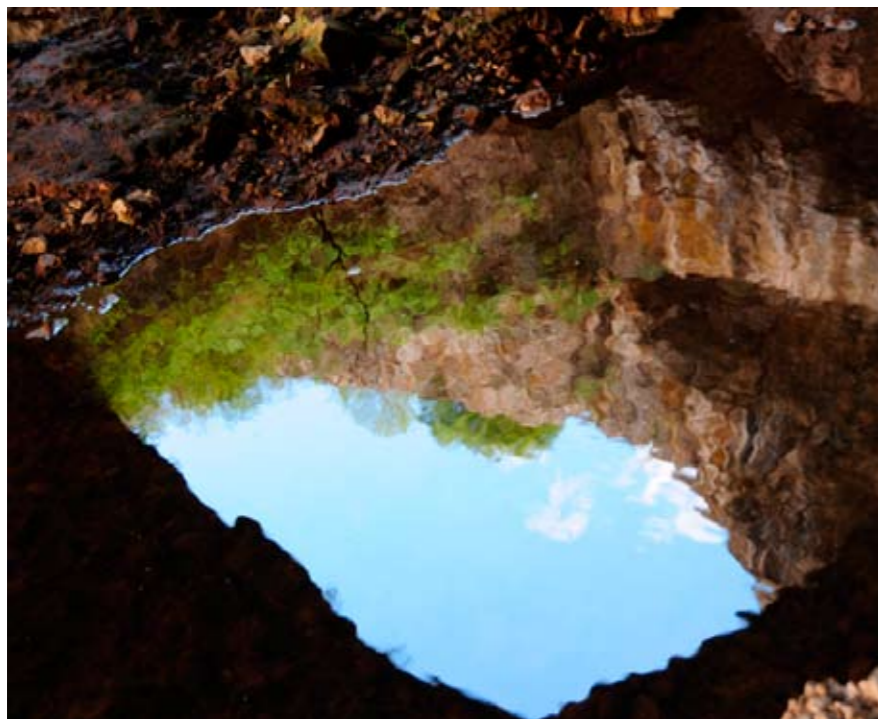
В Деветашката пещера. Огледалото на езерцето отразява небесното око